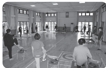
▲ふれあい・いきいきサロン支援事業