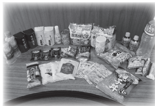
（写真は提供品の一部）