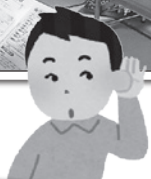
介護サービスについての勉強会