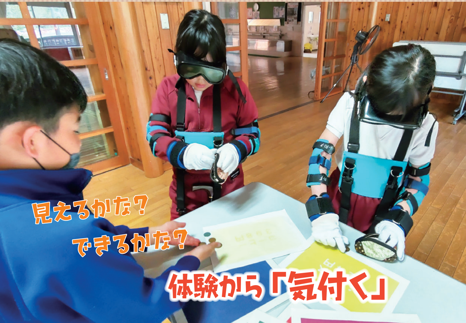
▲高齢者疑似体験の様子（北濃小学校）