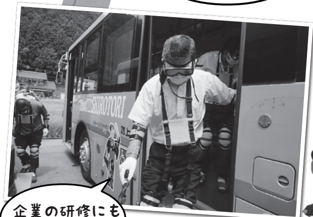
企業の研修にも伺います!