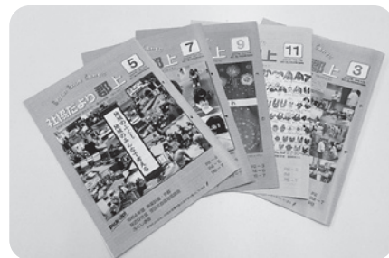
▲社協だより郡上の発行