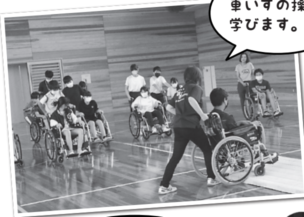
車いすの操作を学びます。